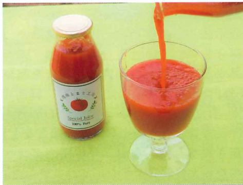
500g 3本セット (2,860円)

湘南の太陽を浴びて育った完熟トマトを追熟し使用しています。丁寧な手作業によりトマト本来の美味しさを引き出しました。食塩も水も加えない、無添加・無香料で旨味たっぷりの飲みやすいとまとジュースです。