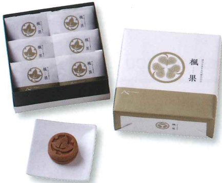
6 個入 (1,200円)