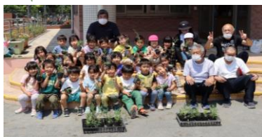
5月11日(木) いずみ保育園