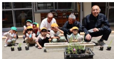
5月12日(金) 富士見保育園 (上) しらゆり保育園 (下)