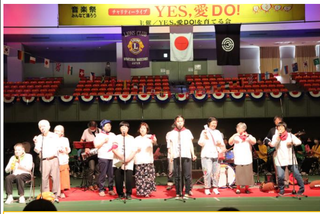
ステージの様子は YOUTUBE でも配信しています。 ぜひ、ご視聴ください!!

令和5年5月27日(土) 歌と踊りの祭典「YES, 愛DO!」 2021年は無観客での演奏を収録して動画配信。2022年は中止。いよいよ今年観客を入れての開催となりました。 「ひら」つかで「つな」がろう! 「ひらつな祭2023(3月)以来のライブとなったとびっきりレインボーズ(器楽同好会)のメンバーはいきいきとした笑顔でステージに立ちました。