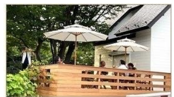
開放的なテラス席

ともしびショップ湘南平 湘南リトルツリー 平塚市万田 790-24 TEL 0463-34-7041