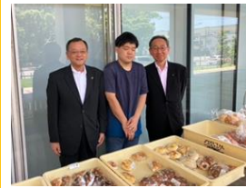
(左)落合市長 (右)津田副市長

6月29日(木)・30日(金)に平塚市役所本館一階の多目的スペースにて、平塚市地域作業所連絡会さんが『夏の展示即売会』を開催。進和学園の自主生産品もたくさん店頭並び、お客様に大好評でした。また落合市長をはじめ津田副市長・今井副市長も立ち寄ってくださいました。次回は、10月26日(木)・27日(金)に秋の展示即売会を予定しています。お楽しみに！