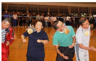
さわやか文化スポーツ大会