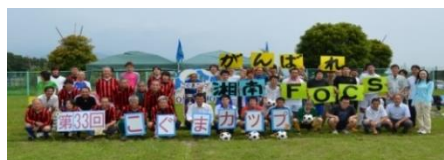
湘南FOCS(サッカー同好会)