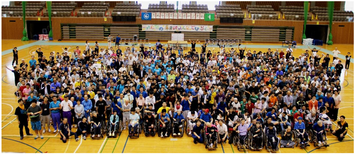
“ みんなの未来は みんなでひらく ” さわやか文化スポーツ大会（ひらつかサン・ライフアリーナにて）