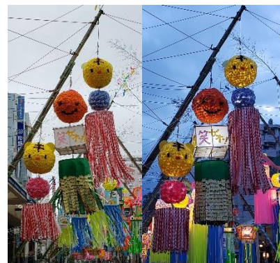
湘南ひらつか七夕まつり