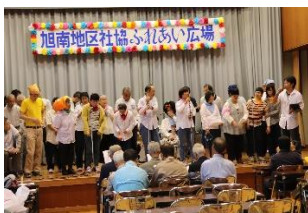
とびっきりレインボーズ（器楽同好会）