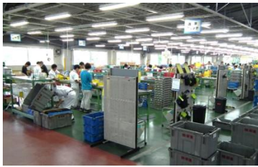
ホンダ車部品組立