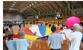
さわやか文化スポーツ大会