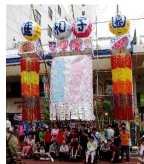
湘南ひらつか七夕まつり