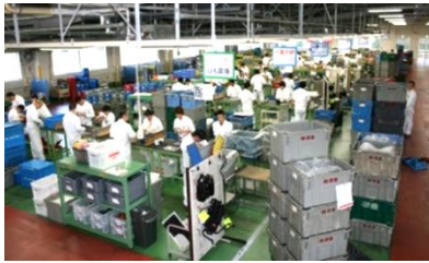
ホンダ車部品組立