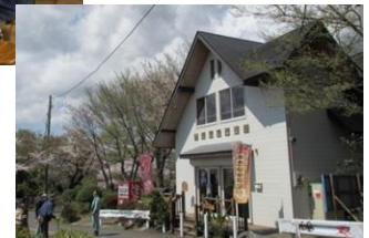
ともしびショップ湘南平