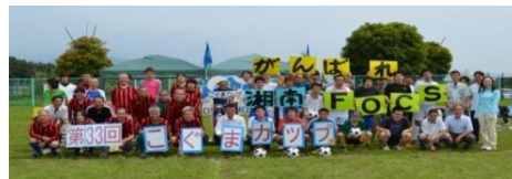
湘南FOCS(サッカー同好会)