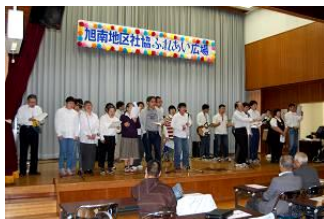
とびっきりレインボーズ（器楽同好会）