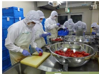
地産のトマトを使用し 製品販売