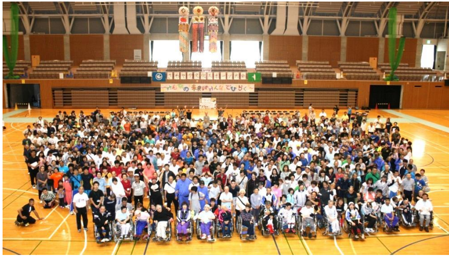
“ みんなの未来は みんなでひらく ” さわやか文化スポーツ大会 (ひらつかサン・ライフアリーナにて)