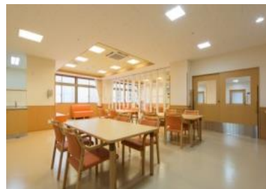
食堂（3ヶ所のうち1つ）