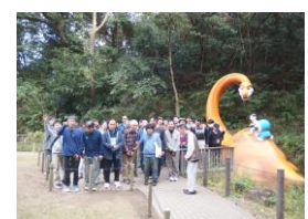
秋のレクリエーション