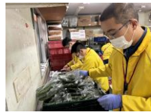
㈱しまむら (バックヤード)